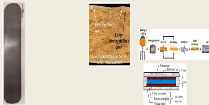
Défaut d'ogive en extrémité irrégularité d'épaisseur du cœur / striction ( https://doi.org/10.1016/j.mtcomm.2022.103910 )

Sa modélisation est souhaitée pour fiabiliser le processus de conception des outillages [2,3]. Elle utilisera un logiciel éléments finis (FEM), Forge NXT, développé par le CEMEF et Transvalor. L'enjeu principal est de matérialiser de manière précise et efficace la co-déformation plastique des trois alliages en contact. Comme dans tout procédé de mise en forme de plusieurs alliages de propriétés mécaniques différentes, le produit peut présenter plusieurs types de défauts : formes d'extrémités, irrégularités d'épaisseur, striction ou rupture de cœur, planéité... De plus, pour éviter la formation de pièges à gaz de fission générateurs de gonflement anisotrope, une microstructure homogène à grains fins est nécessaire pour un bon fonctionnement en réacteur, ainsi qu'une bonne adhésion des interfaces Zr/U-10%Mo. Tout écart à ces spécifications est susceptible de conduire à des hétérogénéités d'échauffement préjudiciables au bon fonctionnement du réacteur.