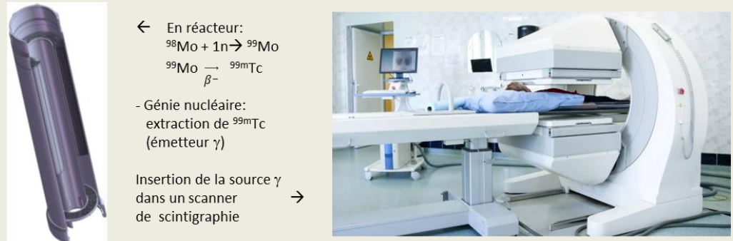
Figure 2 : application à la fabrication du radio-traceur 99m Tc. A gauche : Cœur du réacteur nucléaire FRMII dans lequel sont montées les plaques. A droite : un scanner de scintigraphie.

Sa modélisation est souhaitée pour fiabiliser le processus de conception des outillages [2,3]. Elle utilisera un logiciel éléments finis (FEM), Forge NXT, développé par le CEMEF et Transvalor. L'enjeu principal est de matérialiser de manière précise et efficace la co-déformation plastique des trois alliages en contact. Comme dans tout procédé de mise en forme de plusieurs alliages de propriétés mécaniques différentes, le produit peut présenter plusieurs types de défauts : formes d'extrémités, irrégularités d'épaisseur, striction ou rupture de cœur, planéité... De plus, pour éviter la formation de pièges à gaz de fission générateurs de gonflement anisotrope, une microstructure homogène à grains fins est nécessaire pour un bon fonctionnement en réacteur, ainsi qu'une bonne adhésion des interfaces Zr/U-10%Mo. Tout écart à ces spécifications est susceptible de conduire à des hétérogénéités d'échauffement préjudiciables au bon fonctionnement du réacteur.